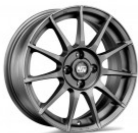
Il nuovo modello MSW 85

Come tutte le ruote prodotte da OZ, anche MSW 85 è omologata TÜV.