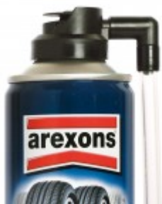
Arexons Gomma Spray Auto