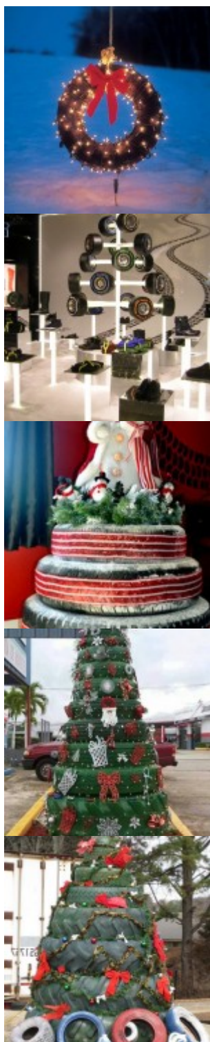
20 Ideas That Help Get Creative With Your Christmas Tree - Best Craft Example