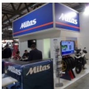
Sotto i riflettori di Eicma il prodotto top di gamma di Mitas: Sport Force