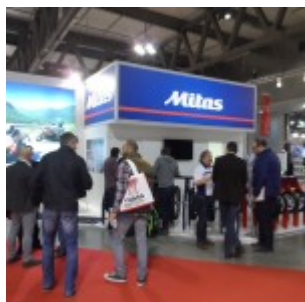
Mitas a Eicma 2016