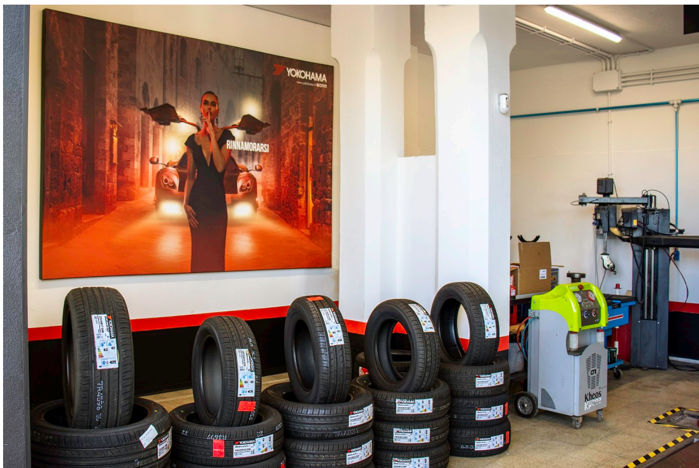
© riproduzione riservata pubblicato il 3 / 08 / 2021