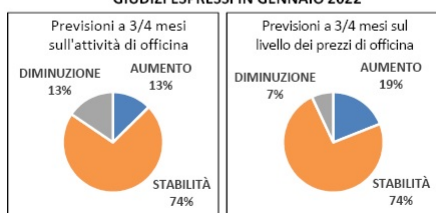
PREVISIONI A 3/4 MESI SU ATTIVITÀ E LIVELLO DEI PREZZI D'OFFICINA GIUDIZI ESPRESSI IN GENNAIO 2022