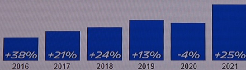
MERCATO ITALIANO TOTALE ALL SEASON

2015 → 2021 MERCATO ALL SEASON ——— +180%