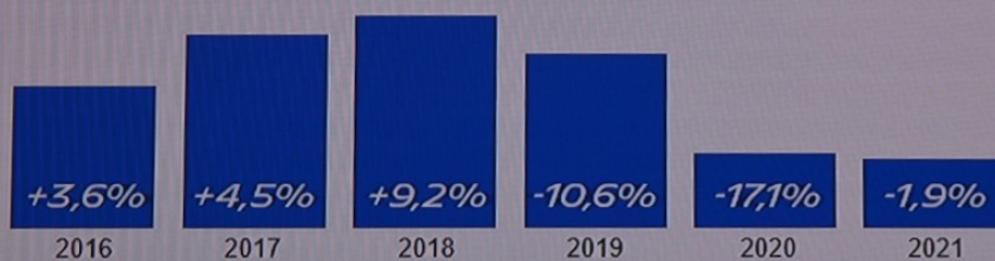
MERCATO ITALIANO TOTALE INVERNO